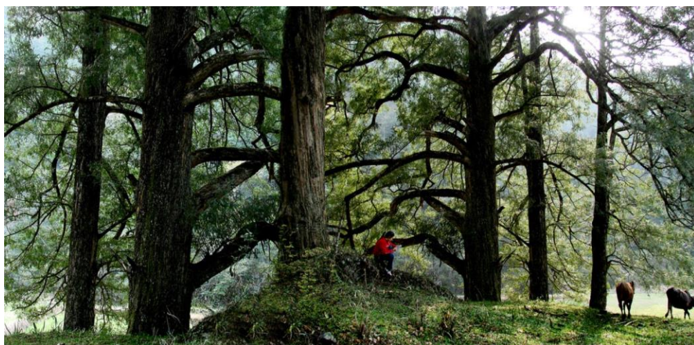
铜鼓红豆杉咖啡茶花亭

(疗)· 养 (老)· 康 (复),就在浸浴「百万棵野生 红豆杉 群落超级最佳负氧离子医疗氧吧」的荟萃中:每立方厘米7~10万个负氧离子,全国最高,就在这人间「失落的地平线」里,天地独立围成一个世外桃源