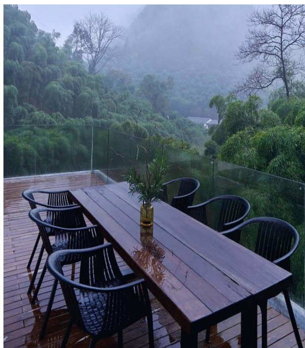
铜鼓医养房居家观景茶台

径(是指树木距地面一米处直径,与胸径相类似)10厘米(cm)以上的野生红豆杉约50万株,且有上千株的群落分布,最大单株米径达1.64米,树龄在1200年以上。在2010年1月,国家林业局正式批准 铜鼓县 花山红豆杉景区为天柱峰国家森林公园,跨涉四乡镇场,面积达1.05万公顷。 铜鼓县 ,被中国野生植物保护协会授予“中国南方红豆杉之乡”称号。形成,国家一级保护珍稀植物「 红豆杉负氧离子医疗超级大氧吧 」:每立方厘米7~10万个负氧离子,全国最高,于是,诞生:「 红豆杉医疗氧吧·医养康照护计划 」。