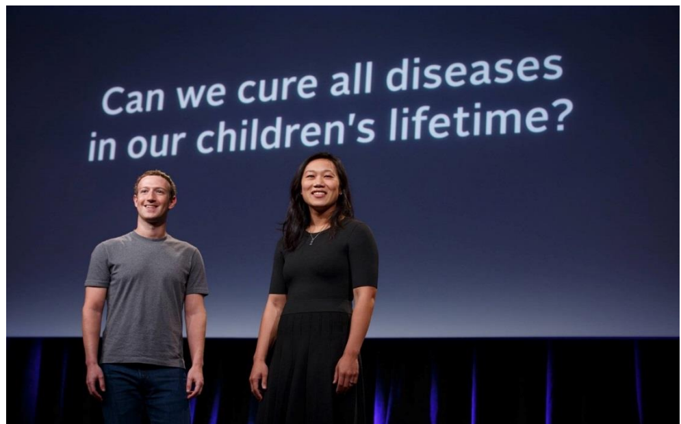
華裔, 陳紮克伯格倡議: 我們能否治好我們孩子一生所有的疾病?

揭开:集团「全球化 3.0 医学(c)」代谢科学(c)战略布局,连结集团下述的「SN 身心灵合一神熵疗法:重新思考癌症(视频)(PD)(PDC)」:从妇女确定怀孕开始的保健,到婴儿出生,婴儿健康照料:从摇篮到坟墓·细胞·SN 身心灵合一·修复·一生健康美好,我们正在承担的路上。