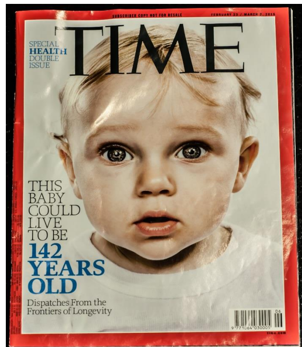
時代封面: 這小孩能活到 142 歲

SN 身心灵合一神熵疗法:重新思考癌症(视频)(PD)(PDC)·2015 年诺贝尔化学奖(e)(c)(c)(c): 神熵沟通 DNA 与细胞(e)-修复(癌)细胞,实施 1974 年诺贝尔医学奖(e)的演讲内容(身心灵合一细胞修复): 细胞即将来临的时代,生命,这个反熵,不断地用能量重新装载,是一种攀登的力量,朝向混乱中的秩序,走向光明,在无限的黑暗之中,朝向爱的神秘梦想,在吞噬自己的火焰和寒冷的寂静之间。这种性质不接受退位,也不接受怀疑。(The Coming Age of the Cell: Life, this anti-entropy, ceaselessly reloaded with energy, is a climbing force, toward order amidst chaos, toward light, among the darkness of the indefinite, toward the mystic dream of Love, between the fire which devours itself and the silence of the Cold. Such a Nature does not accept abdication, nor skepticism.), 转化「癌症生物物理学(1ec)(2ec)(3ec)(4ec)」与 Harvard-MIT 的研究报告:「癌细胞的生物力学和生物物理学(ec), 显著