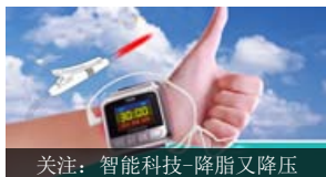
关注：智能科技-降脂又降压