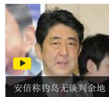
安倍称钓鱼岛无谈判余地