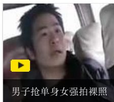
男子抢单身女强拍裸照