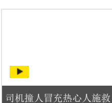
司机撞人冒充热心人施救