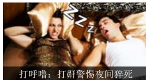
打呼噜：打鼾警惕夜间猝死