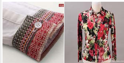
初语 袖口民族感拼接文艺小 2012秋季新款 女士100%桑 ¥ 198.00 ¥ 248.00