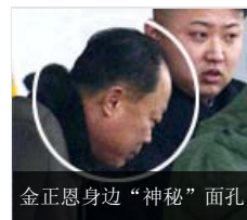
金正恩身边“神秘”面孔