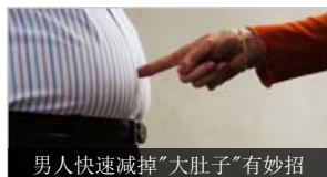
男人快速减掉“大肚子”有妙招