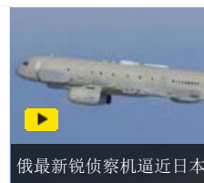
俄最新锐侦察机逼近日本