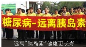
远离“胰岛素”健康更长寿