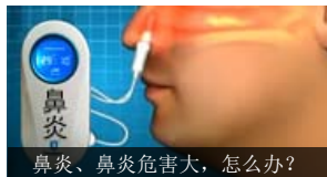
鼻炎、鼻炎危害大，怎么办？