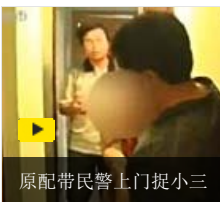
原配带民警上门捉小三