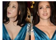
刘晓庆捞金双乳呼之欲出