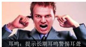
耳鸣：提示长期耳鸣警惕耳聋