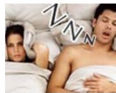
打呼噜: 警惕夜间猝死