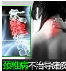
颈椎病不治导瘫痪