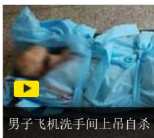
男子飞机洗手间上吊自杀