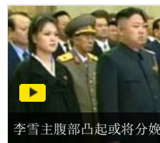
李雪主腹部凸起或将分娩