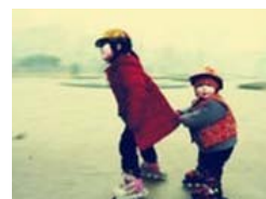
80后童年冬天是这样过的

中国糖尿病患病率为9.7%，已高过世界平均水平的6.4%。同时，中国糖尿病高危人群也在扩大，约有1.5亿人。国际糖尿病联盟主席吉恩·克劳德·穆班亚教授强调，坚