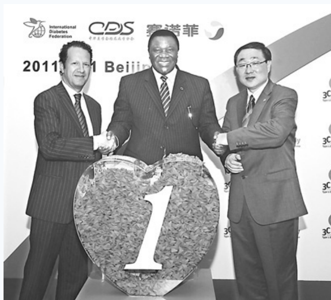
图为1型糖尿病研究项目启动现场

2011年08月19日 09:57 来源: 人民日报海外版 参与互动(4) 【字体: 上大 下小】