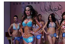
比基尼小姐秀身材