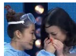
无语！闻屁师年薪高达30万