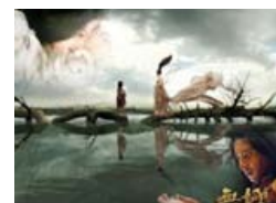
盘点电影中的唯美背景