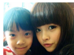
你相信她已经是人母了吗