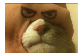
老外另类幽默照笑死人