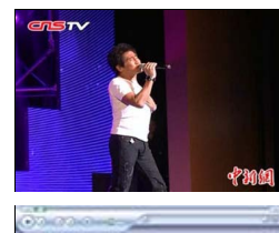
齐秦王杰迪克牛仔兰州开唱