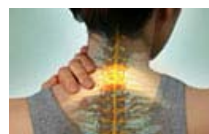
颈椎病发作的原因