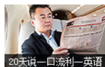
20天说一口流利一英语