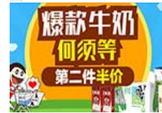
天猫超市 牛奶狂购