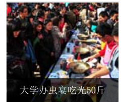
大学办虫宴吃光50斤