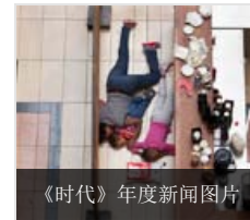
《时代》年度新闻图片

今年90岁的蔡奶奶因身体不适到浙江大学医学院附属第一医院就诊。医生开出的四项检查，