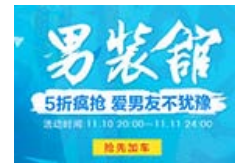
广告 丽说 男装开馆