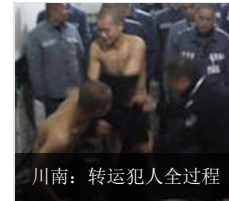
川南：转运犯人全过程