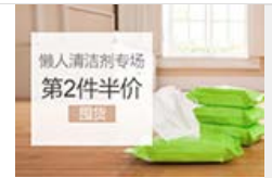
丽芙家居 清洁专场