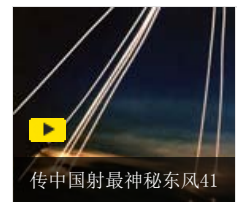
传中国射最神秘东风41