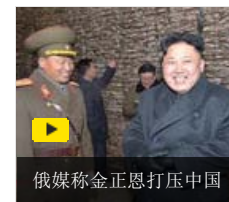
俄媒称金正恩打压中国